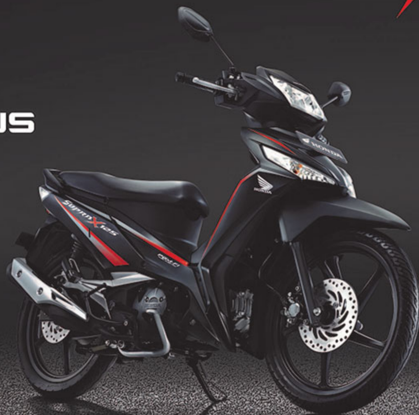
NEW QUANTUM MATTE BLACK