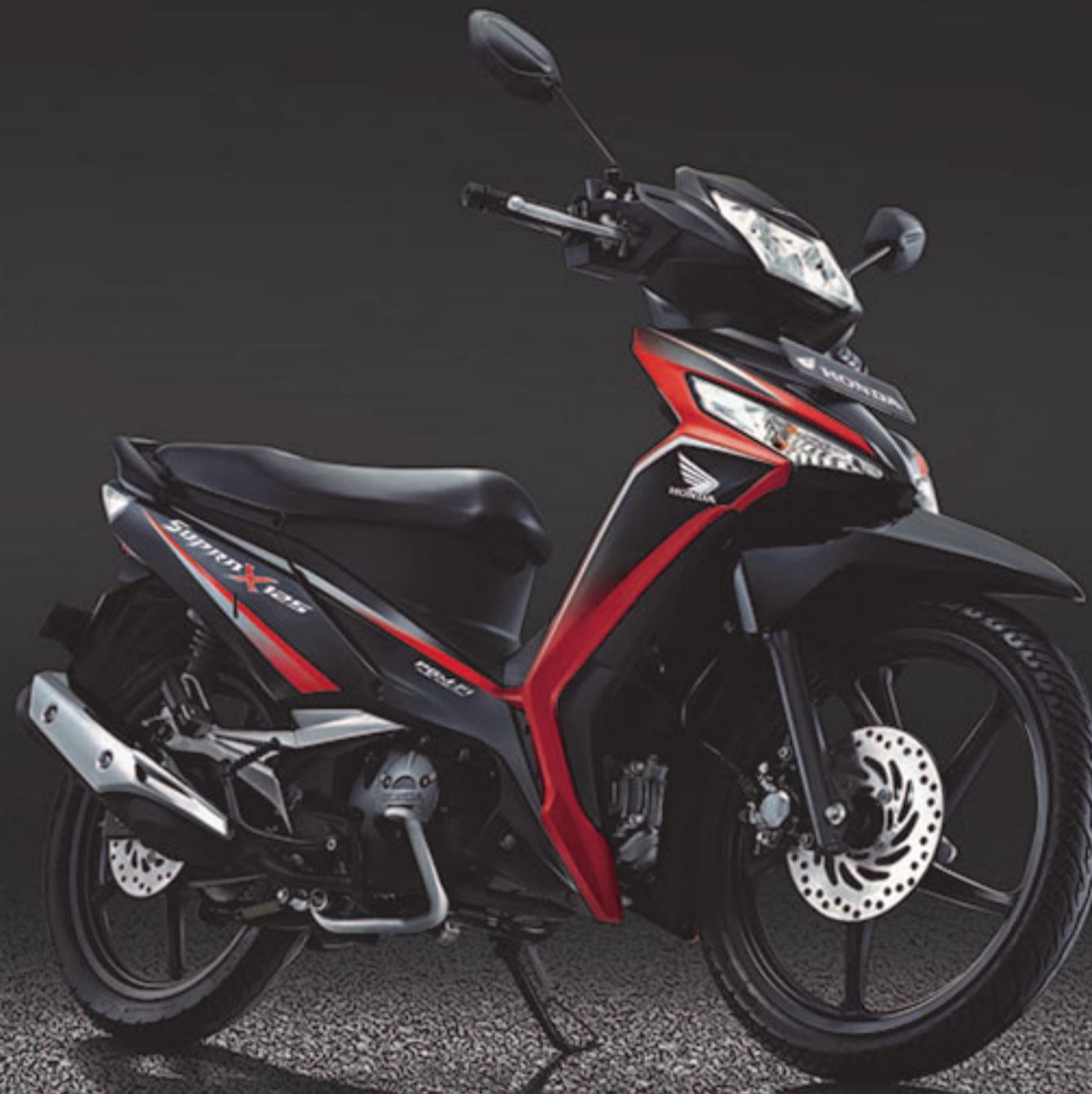
NEW ENERGETIC RED*