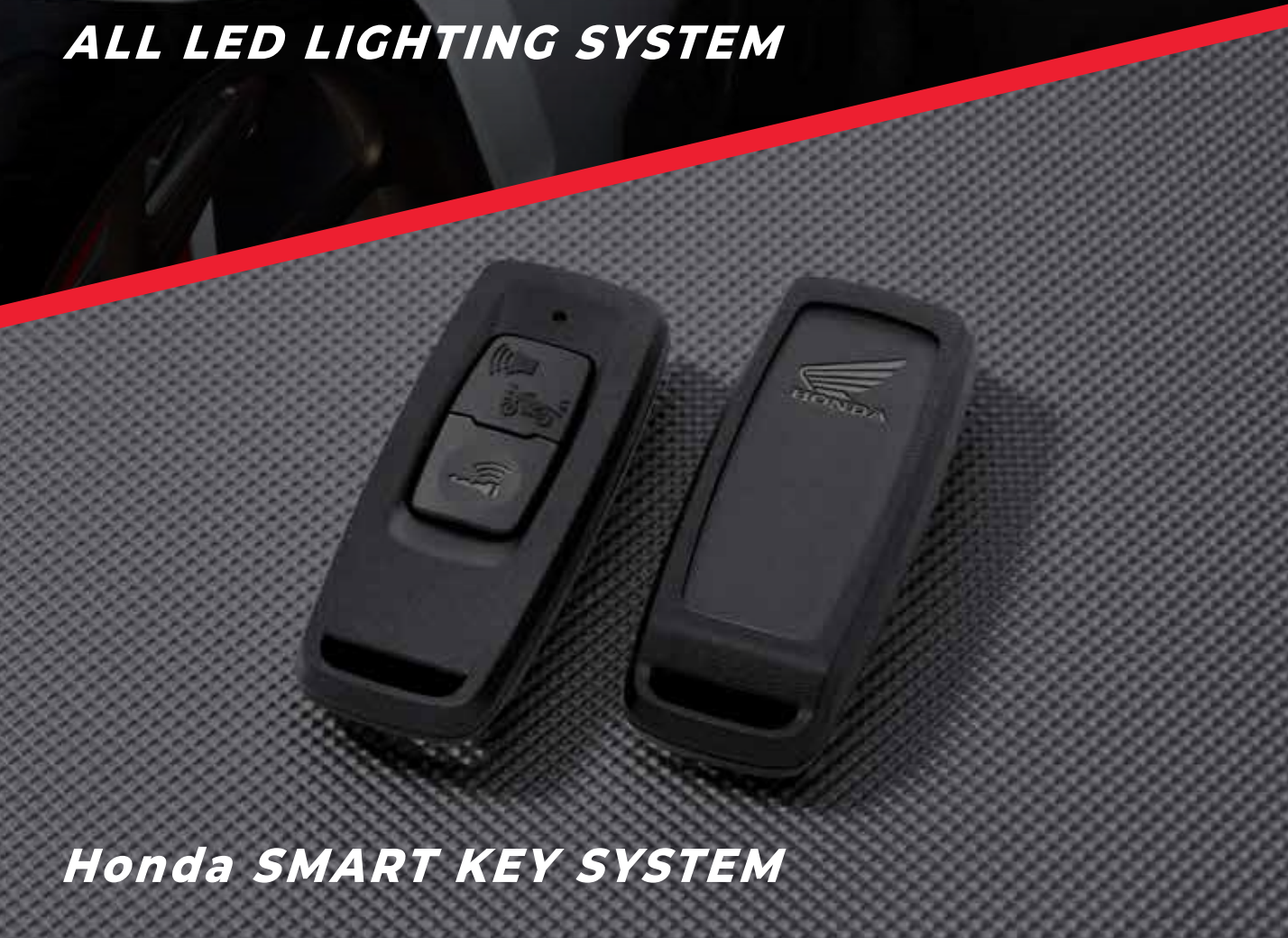
Honda SMART KEY SYSTEM