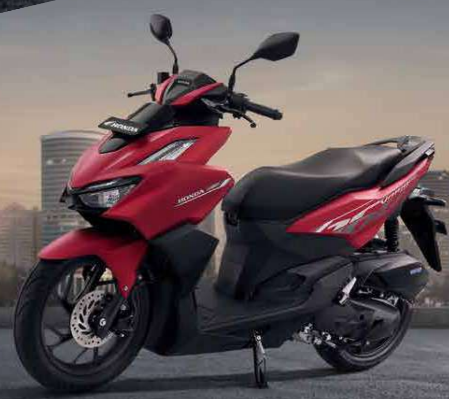
NEW STRIPE ACTIVE MATTE RED