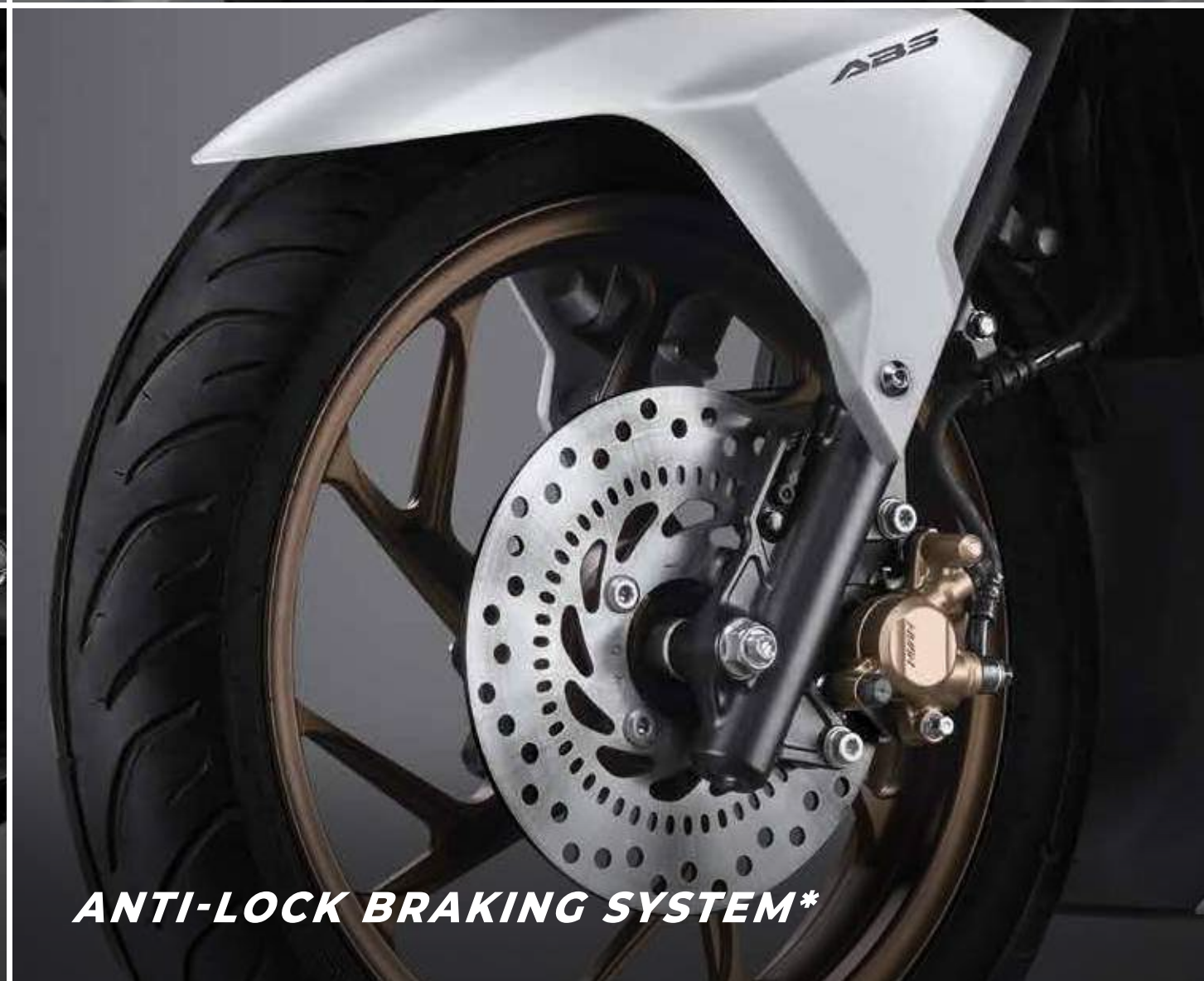
ANTI-LOCK BRAKING SYSTEM*