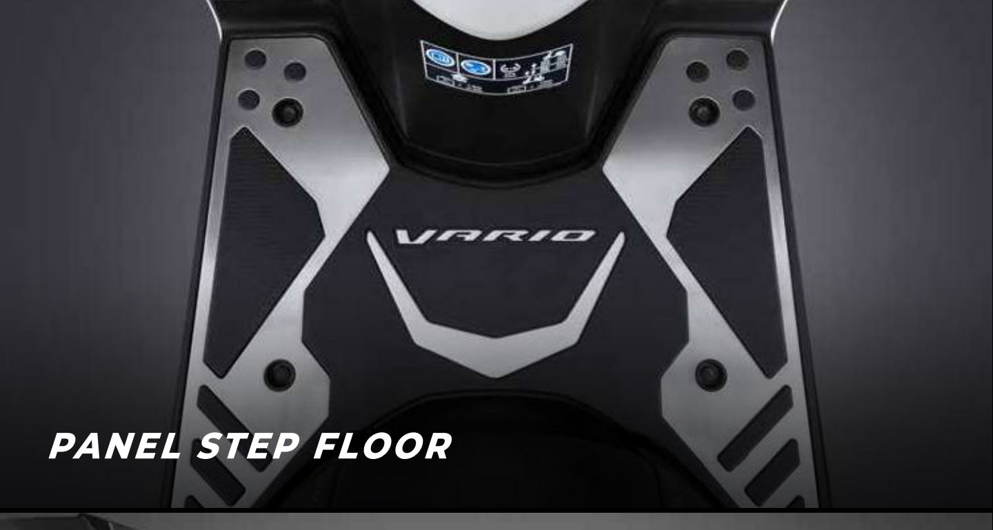
PANEL STEP FLOOR