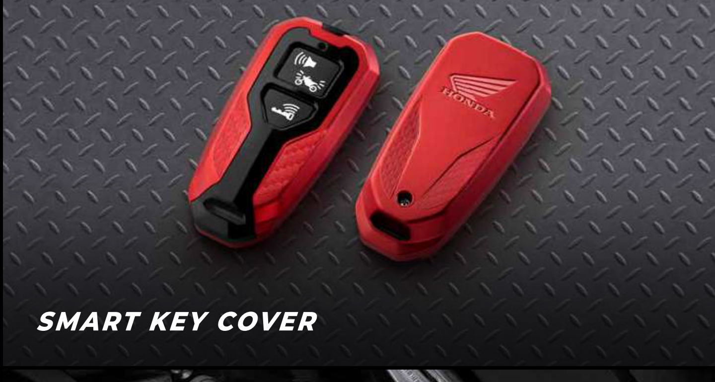
SMART KEY COVER