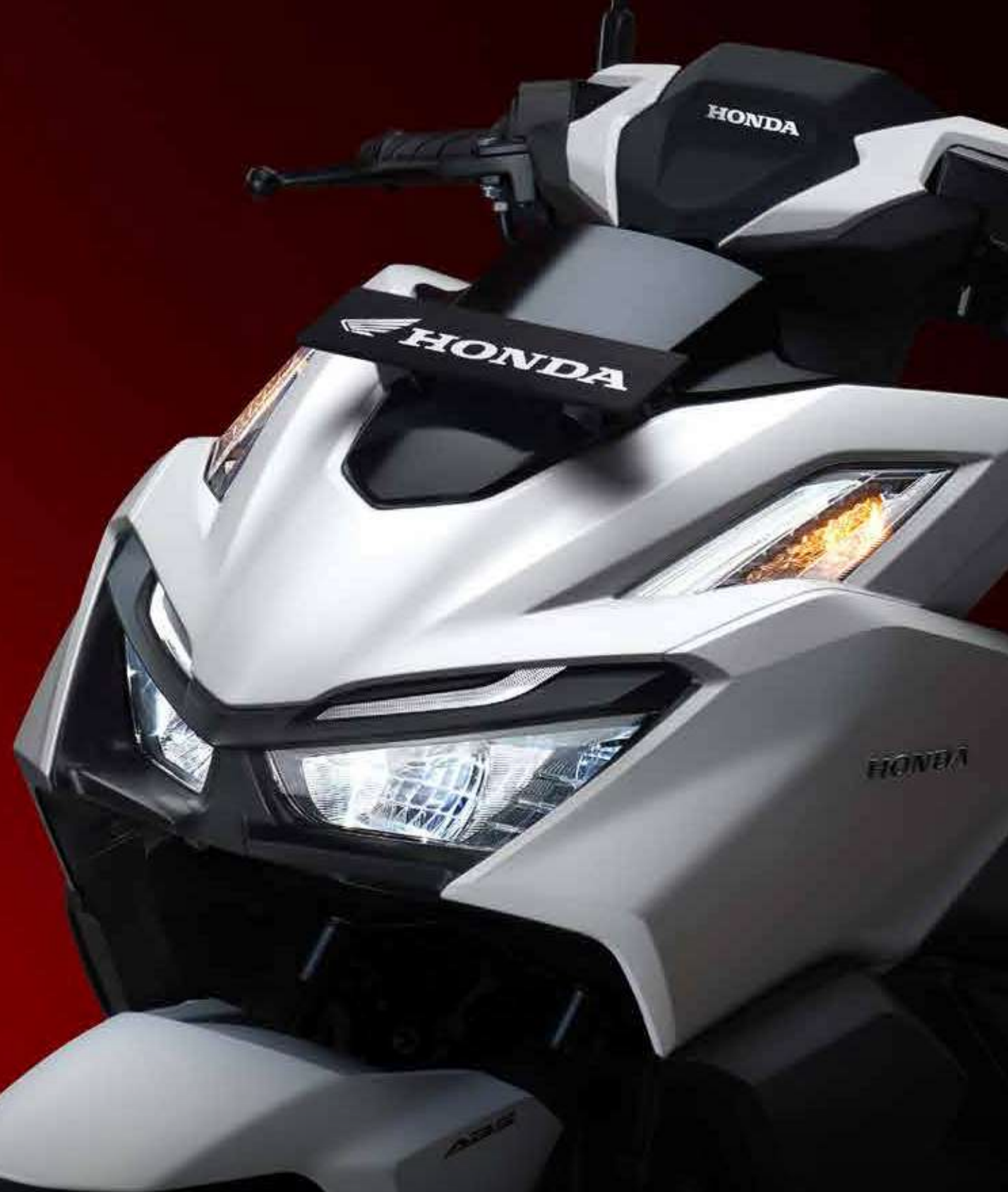
ALL LED LIGHTING SYSTEM