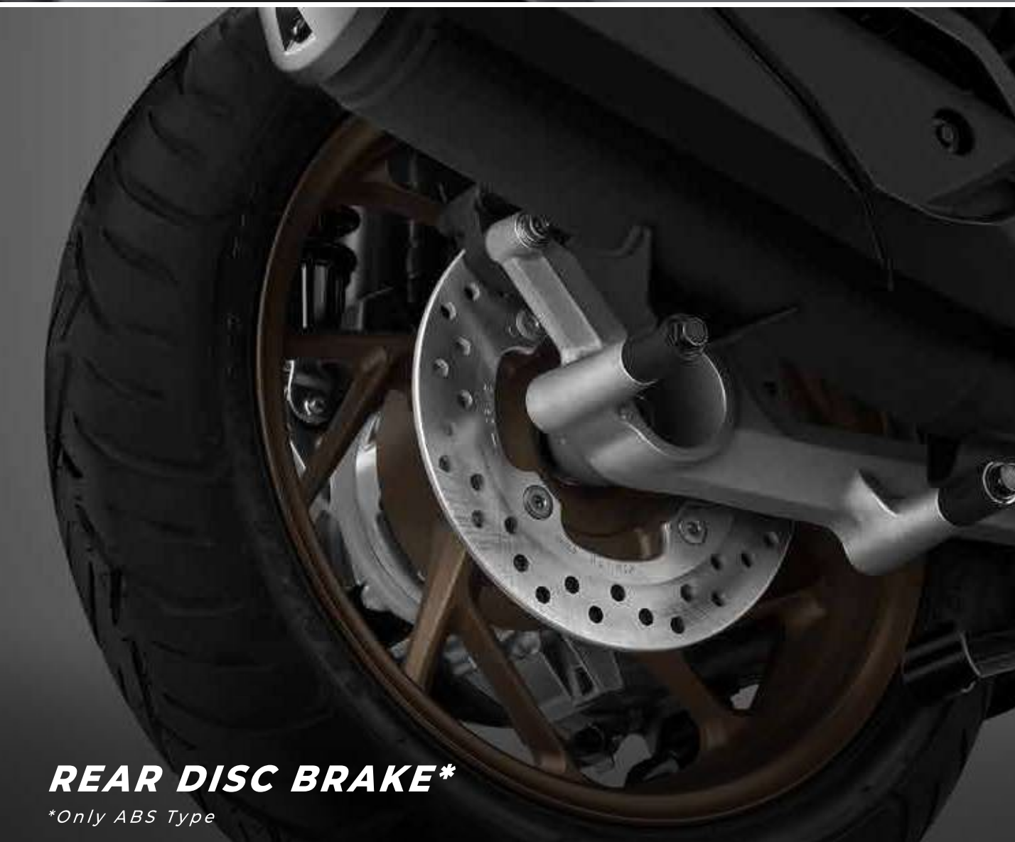
REAR DISC BRAKE*