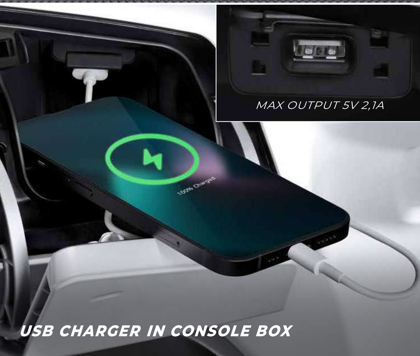
USB CHARGER IN CONSOLE BOX