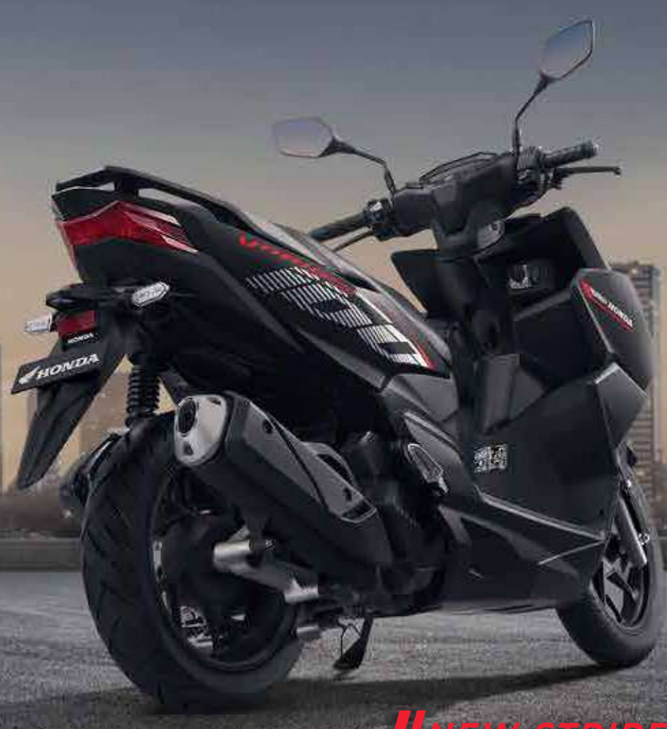
NEW STRIPE ACTIVE MATTE BLACK