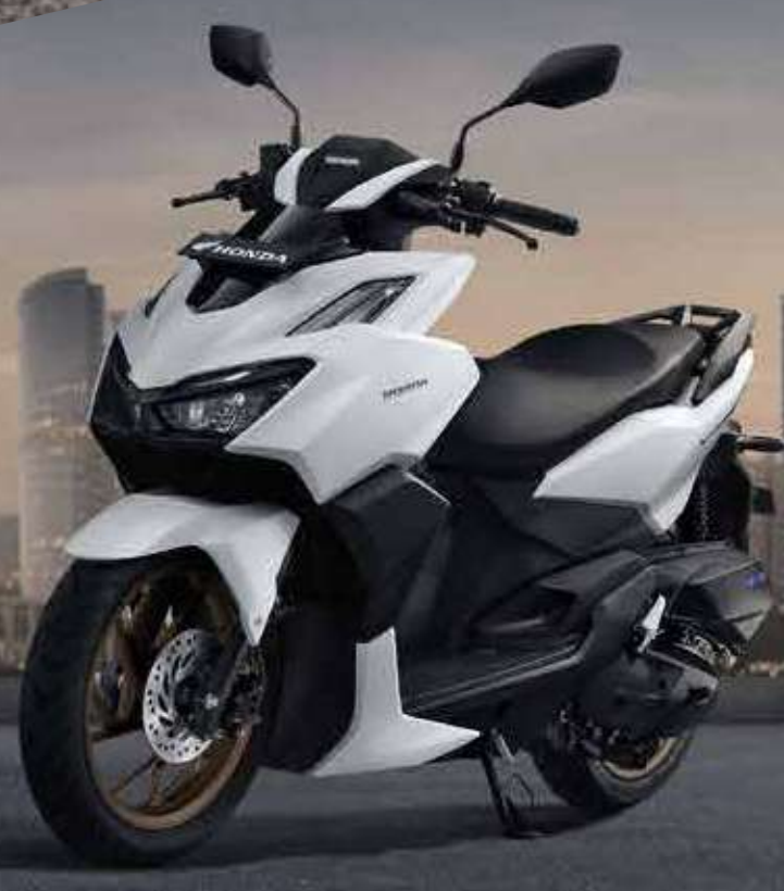
NEW COLOR GRANDE MATTE WHITE