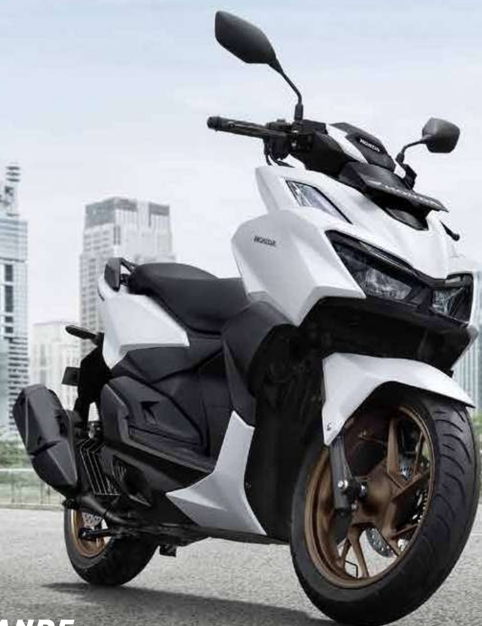
GRANDE MATTE WHITE