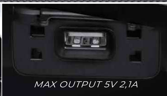
MAX OUTPUT 5V 2,1A