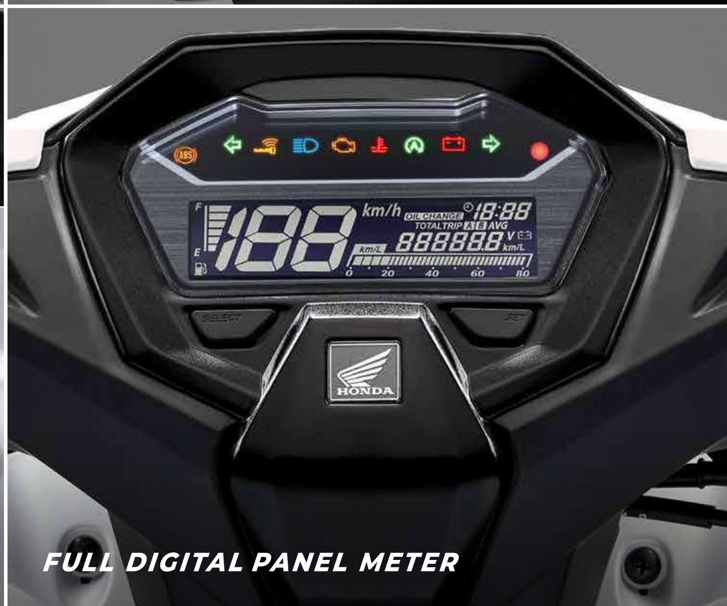
FULL DIGITAL PANEL METER