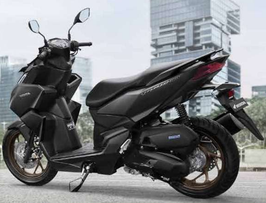
GRANDE MATTE BLACK