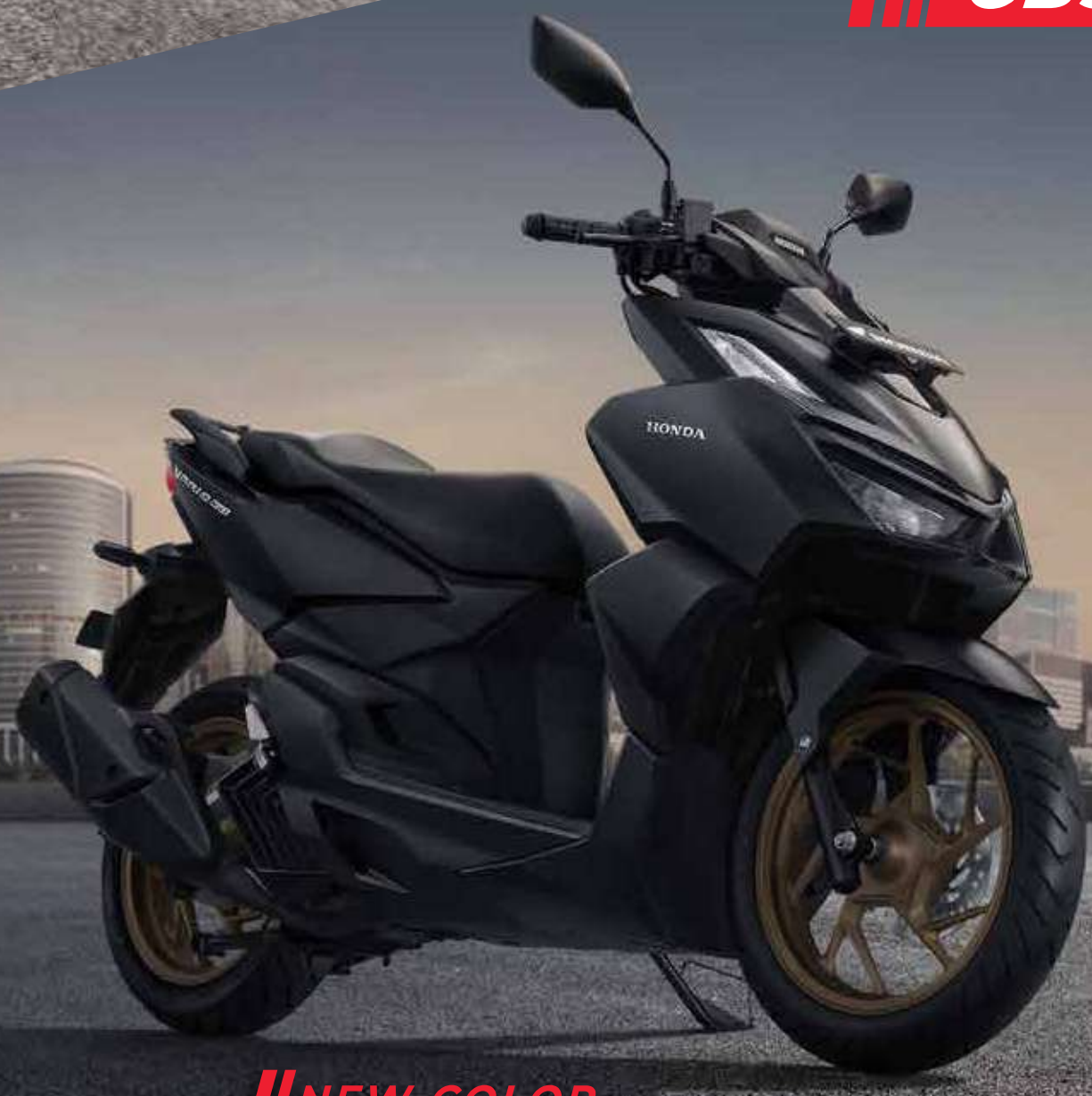
NEW COLOR GRANDE MATTE BLACK