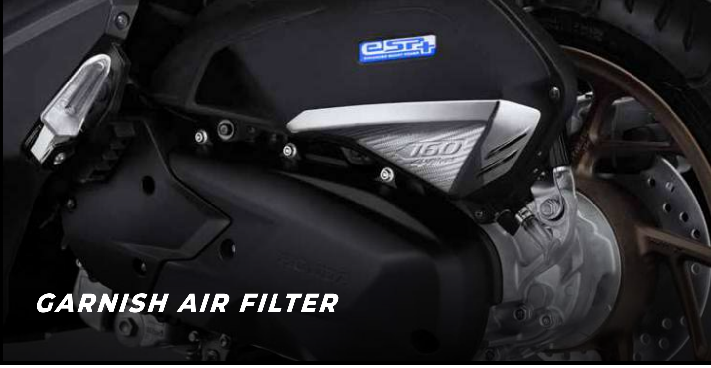
GARNISH AIR FILTER