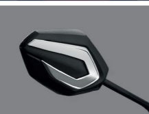
GARNISH BACK MIRROR