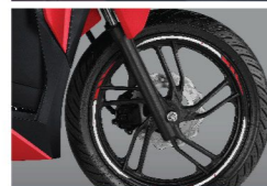
WHEEL LIST STICKER