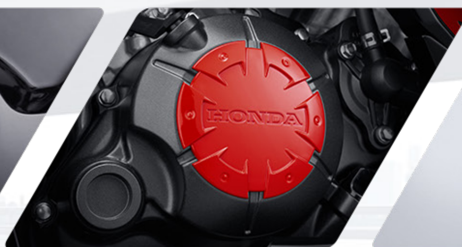
CRANKCASE ENGINE PROTECTOR