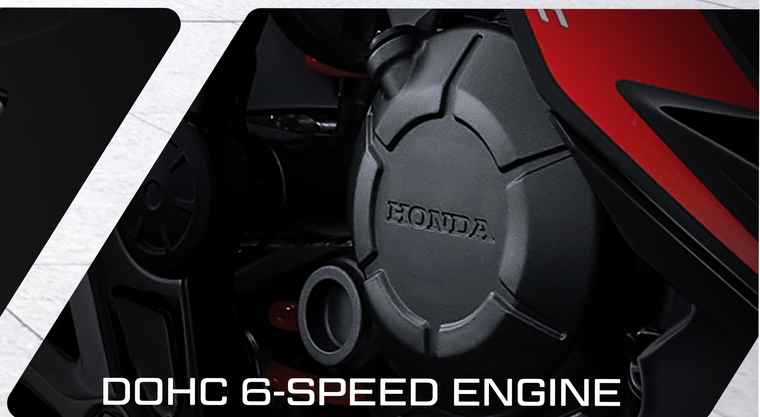
DOHC 6-SPEED ENGINE