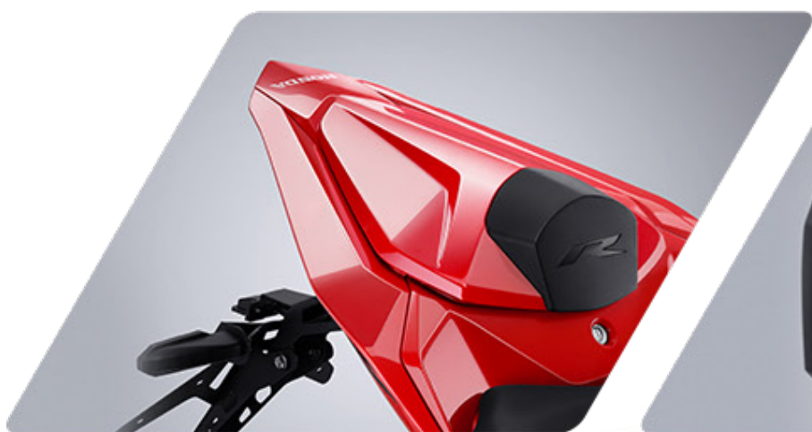
SINGLE SEAT COWL