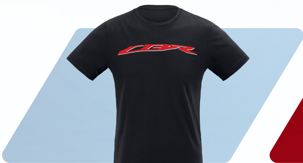
T - SHIRT