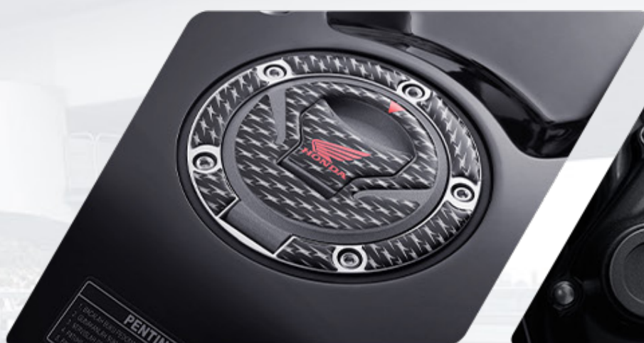
FUEL LID PAD