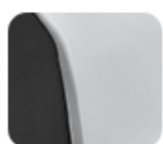
Innovative White (EM 1 e:)