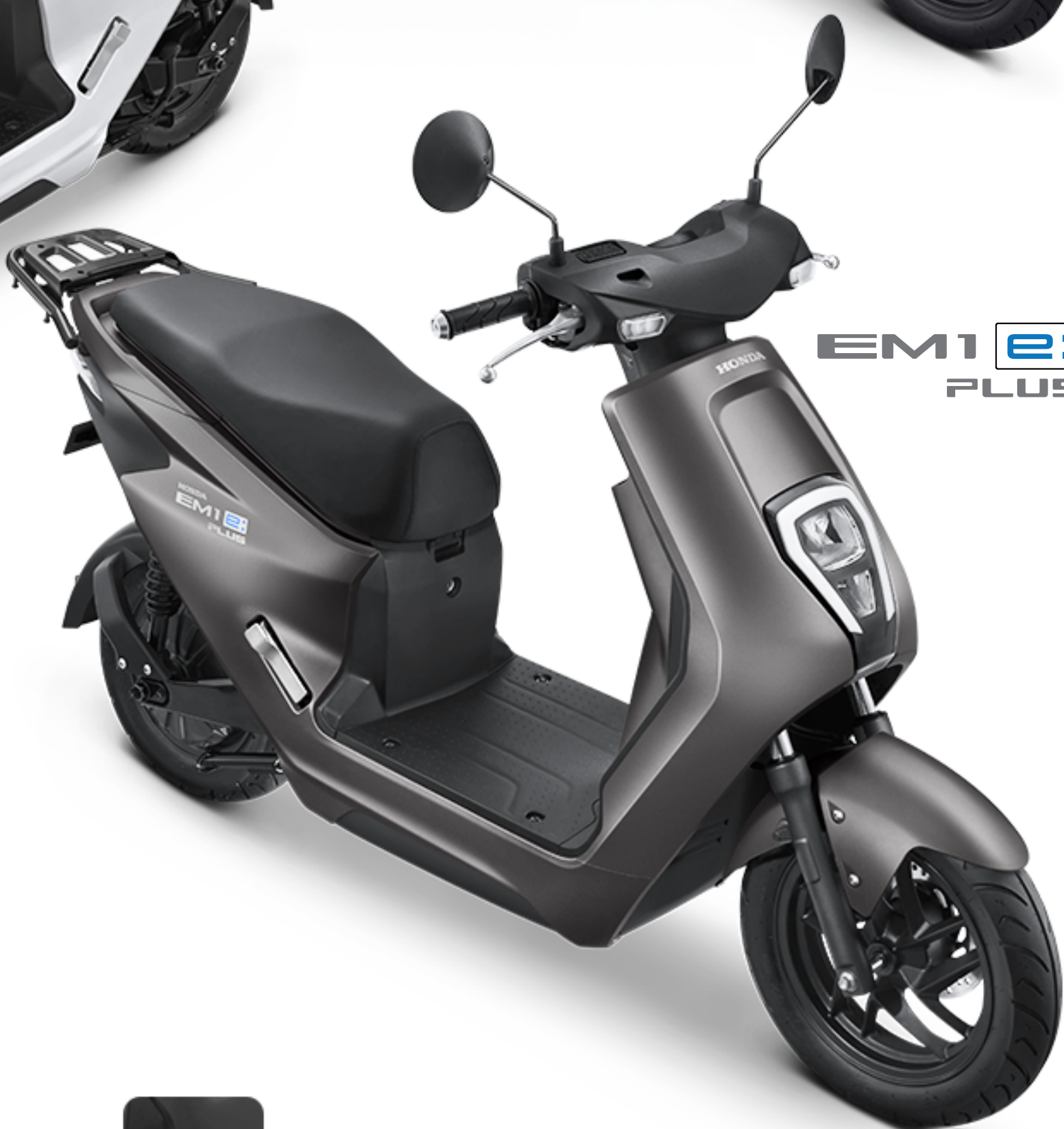
EM1 e: PLUS