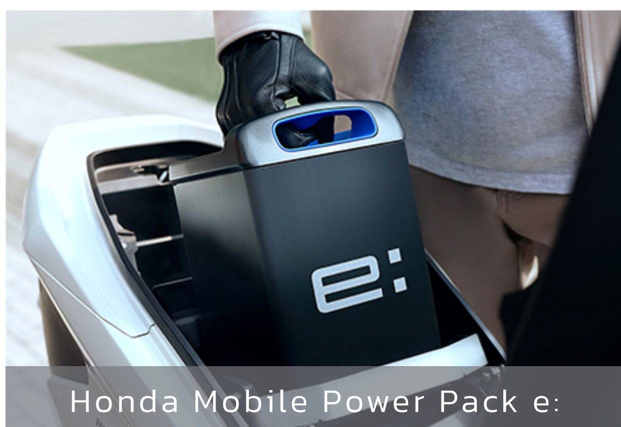
Honda Mobile Power Pack e: