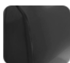
Excellent Matte Silver (EM 1 e: PLUS)