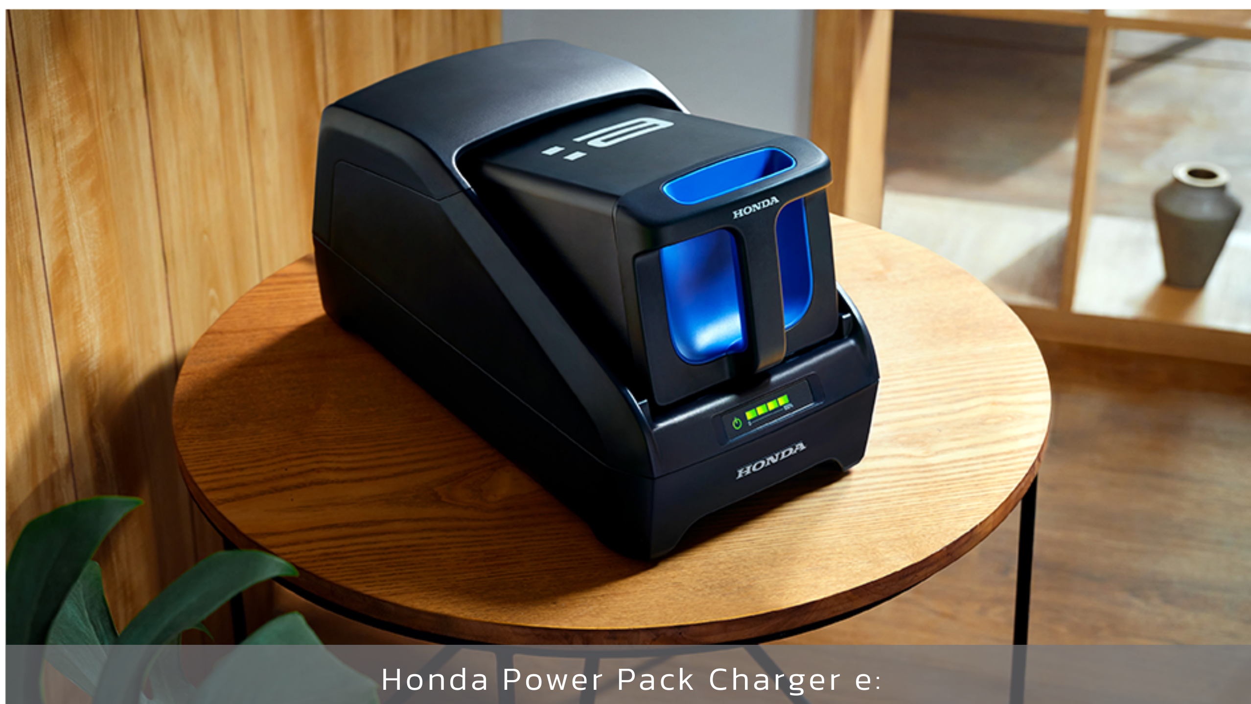
Honda Power Pack Charger e: