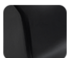
Intelligent Matte Black (EM 1 e:)