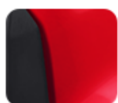
Smart Red (EM 1 e:)