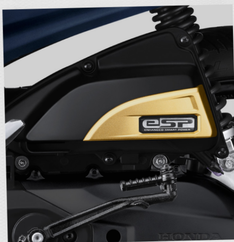
Garnish Air Cleaner*