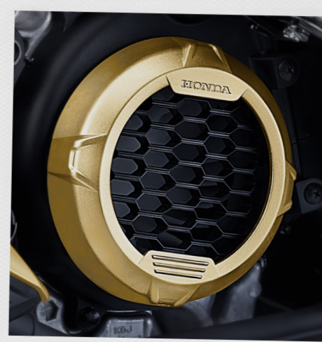
Garnish Fan Cover*