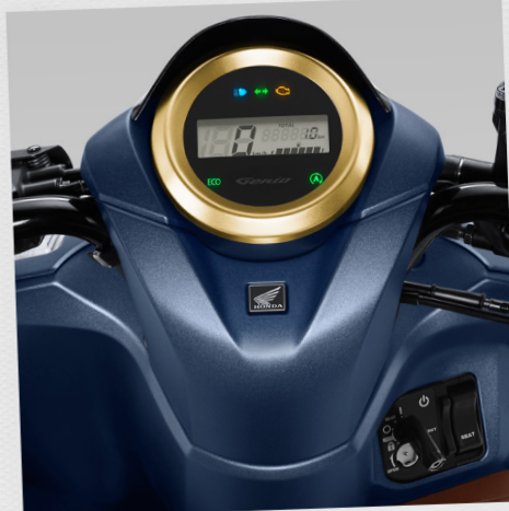
Garnish Panel Meter*