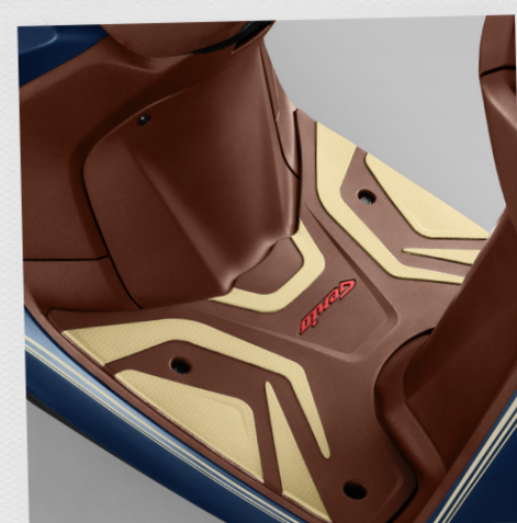
Rubber Step Floor*