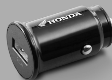
Honda M/C USB Charger