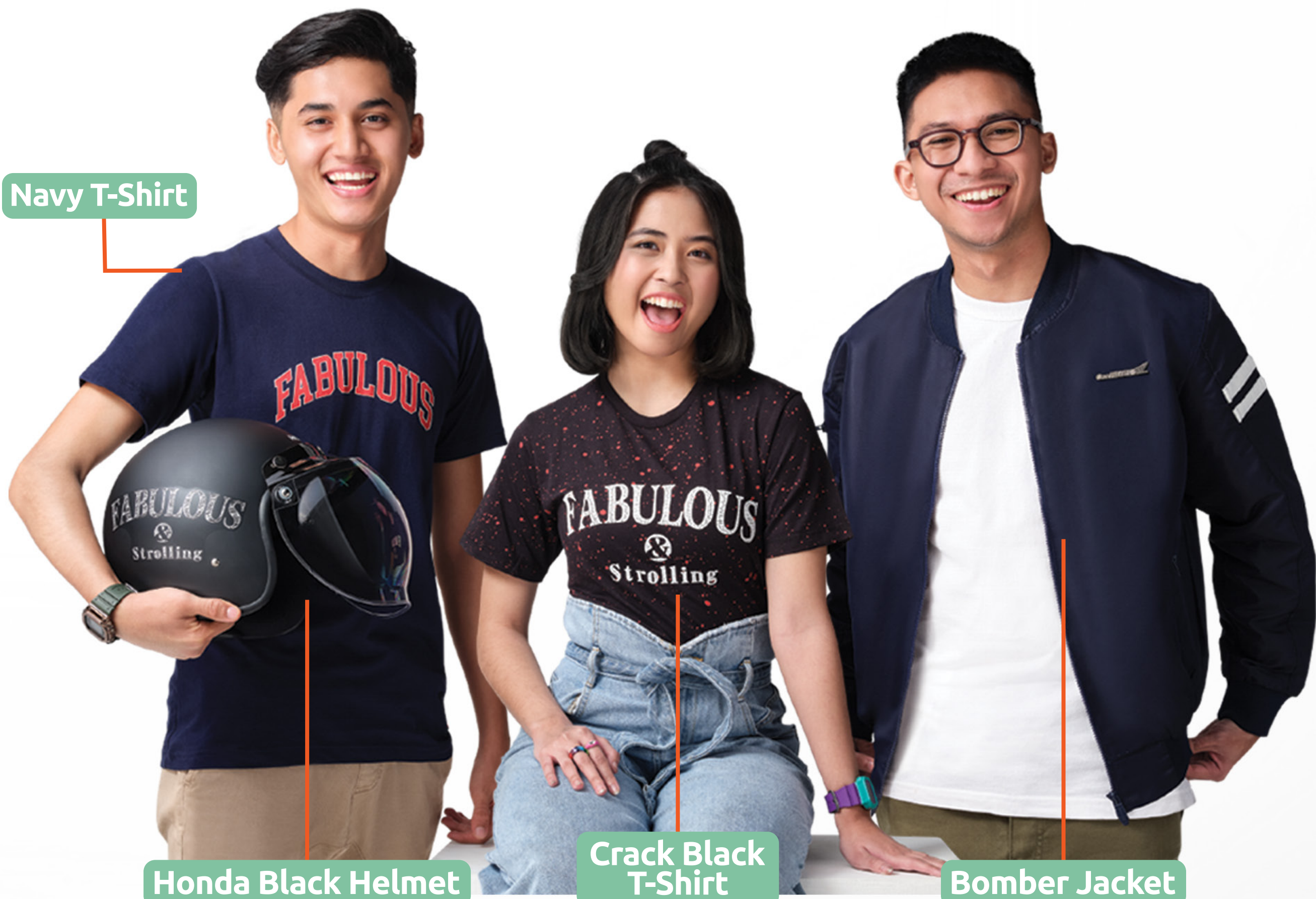
Honda Black Helmet