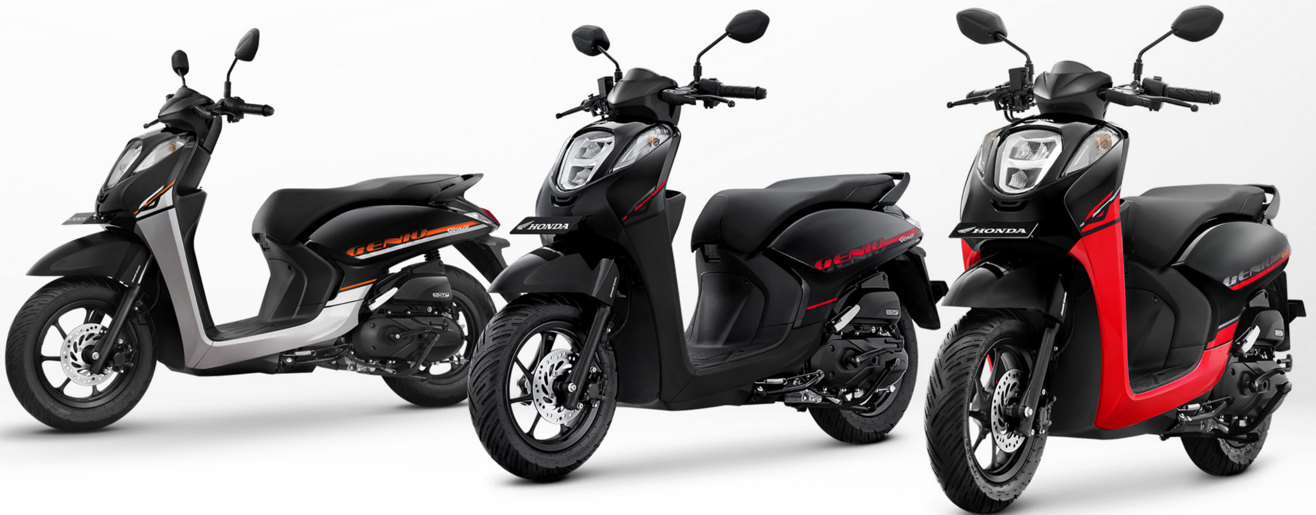
Radiant Silver Black (Tipe CBS)