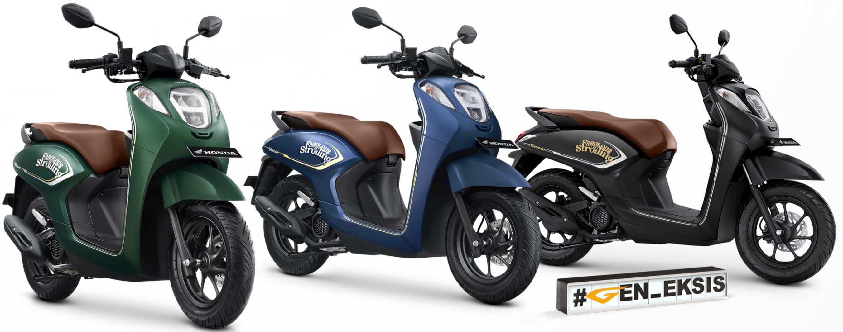
Fabulous Matte Green (Tipe CBS-ISS)