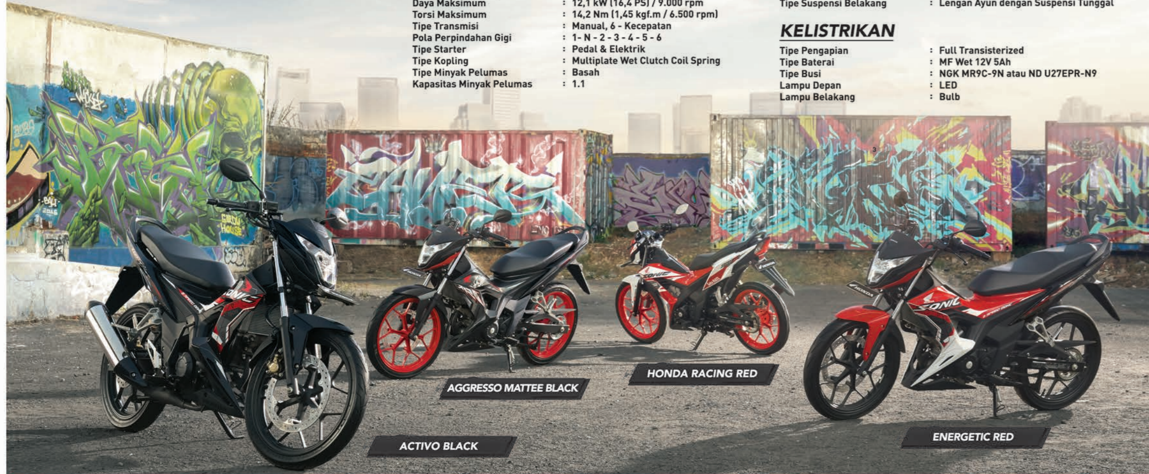
AGGRESSO MATTEE BLACK