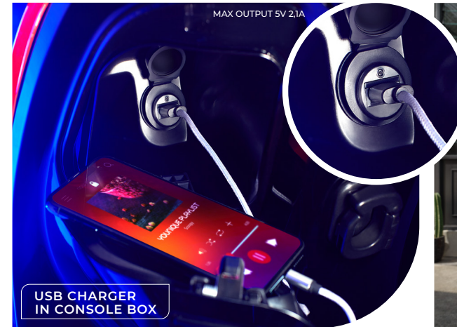
USB CHARGER IN CONSOLE BOX