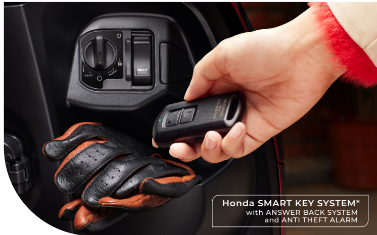
Honda SMART KEY SYSTEM* with ANSWER BACK SYSTEM and ANTI THEFT ALARM