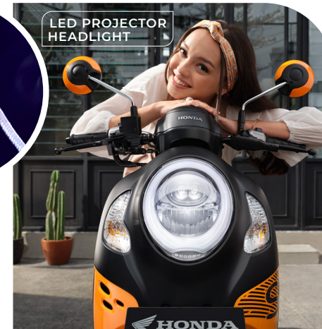
LED PROJECTOR HEADLIGHT