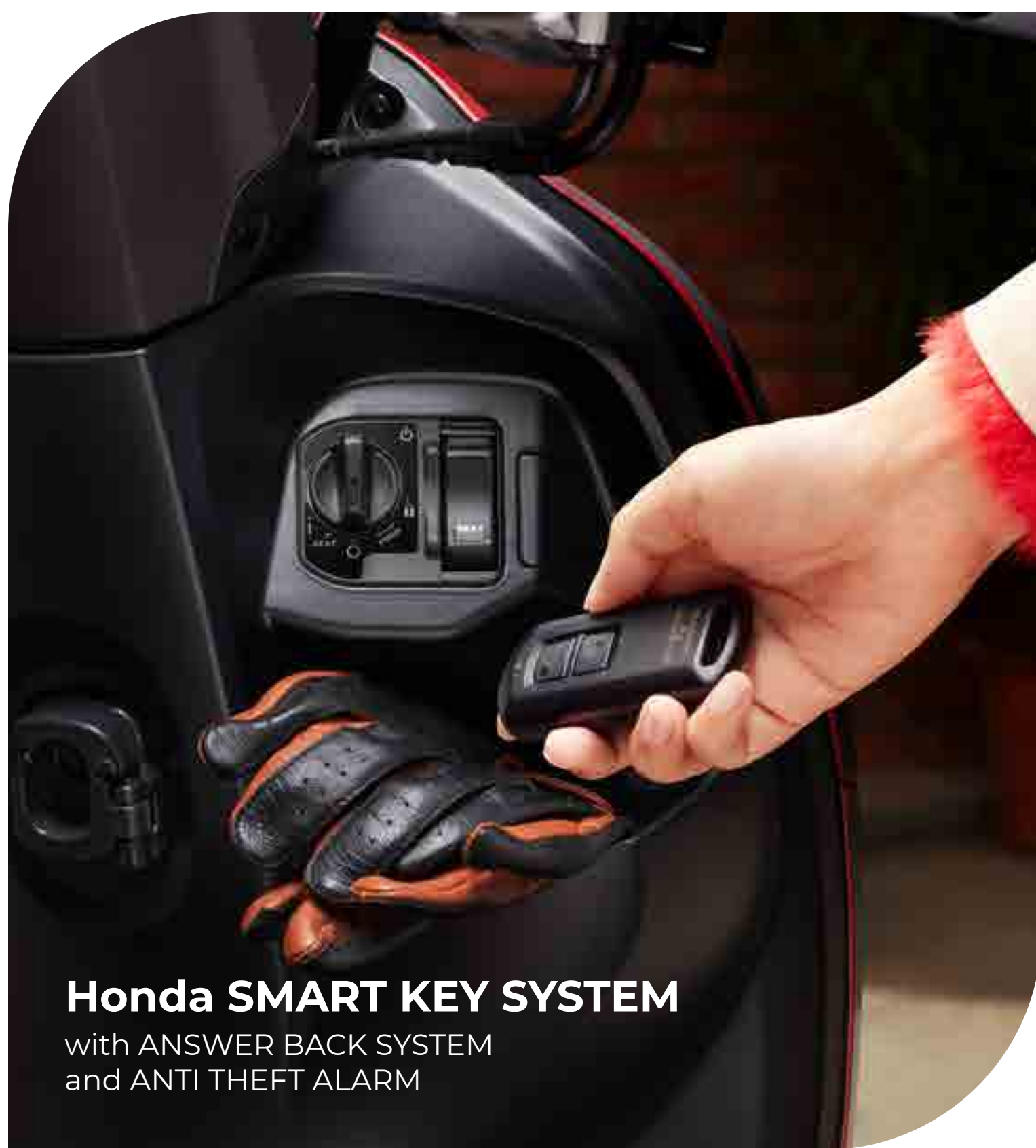
Honda SMART KEY SYSTEM

with ANSWER BACK SYSTEM and ANTI THEFT ALARM