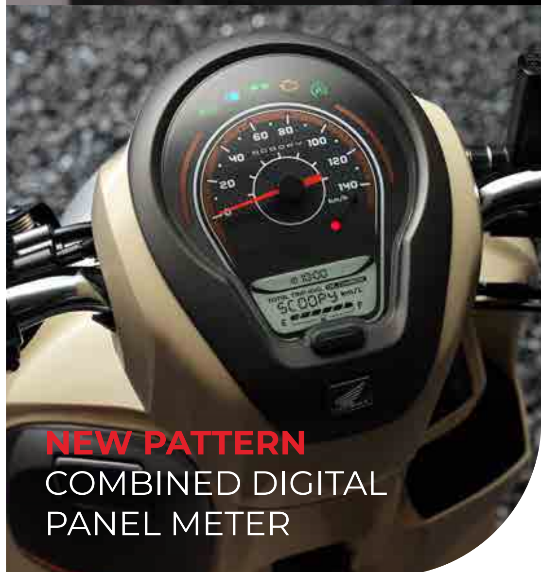
NEW PATTERN COMBINED DIGITAL PANEL METER