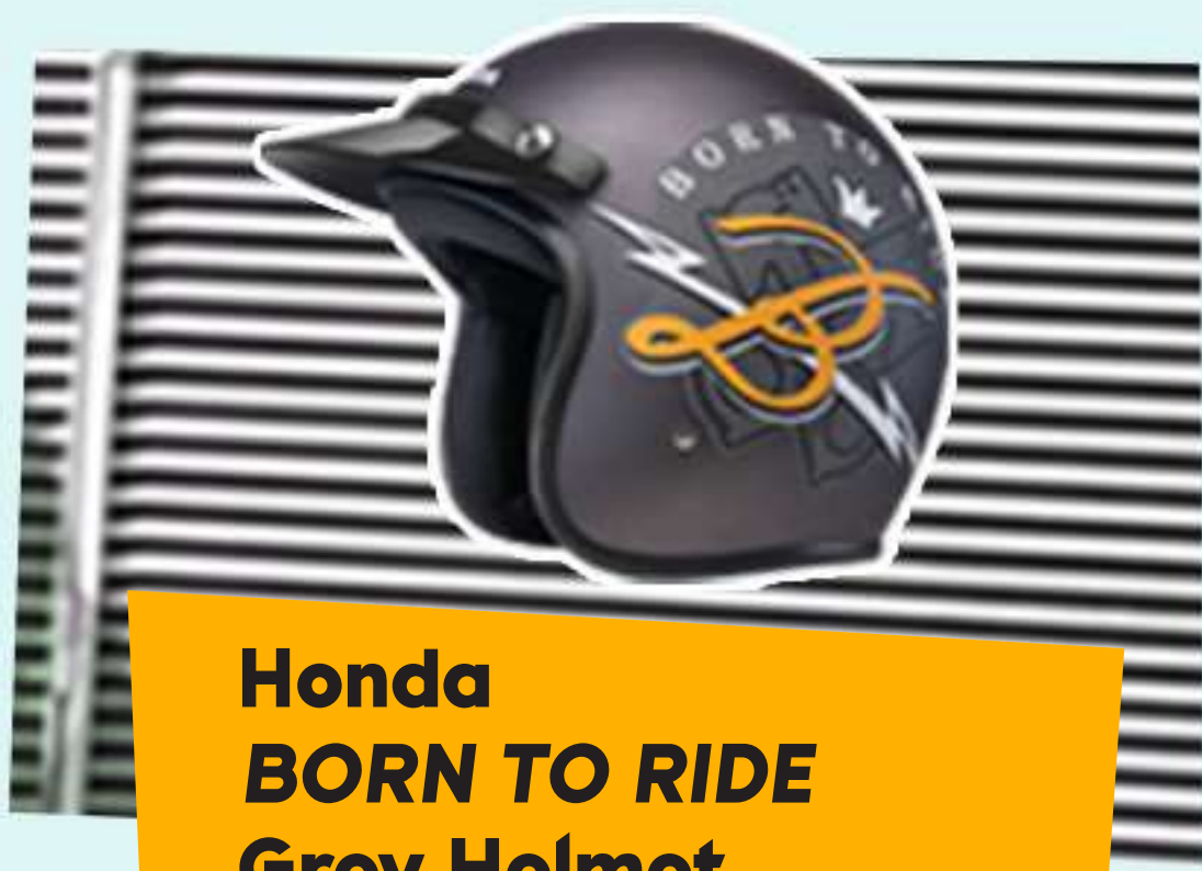
Honda BORN TO RIDE Grey Helmet

Born to Ride Black T-Shirt, Born to Ride Snapback, Born to Ride Rubber Band