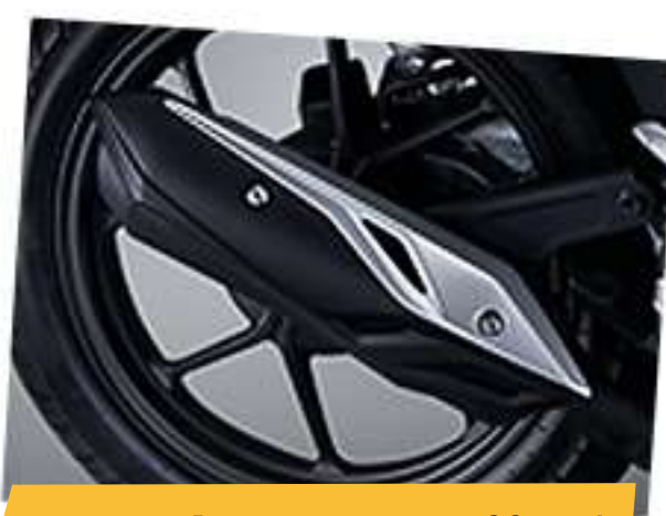
Garnish Cover Muffler*