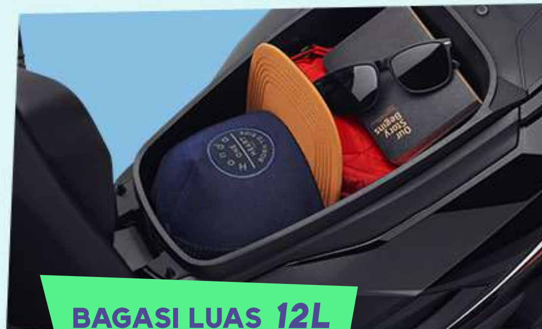
BAGASI LUAS 12L