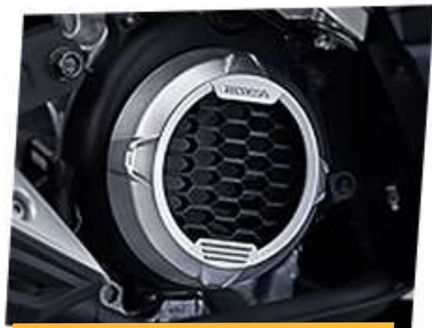
Garnish Fan Cover*