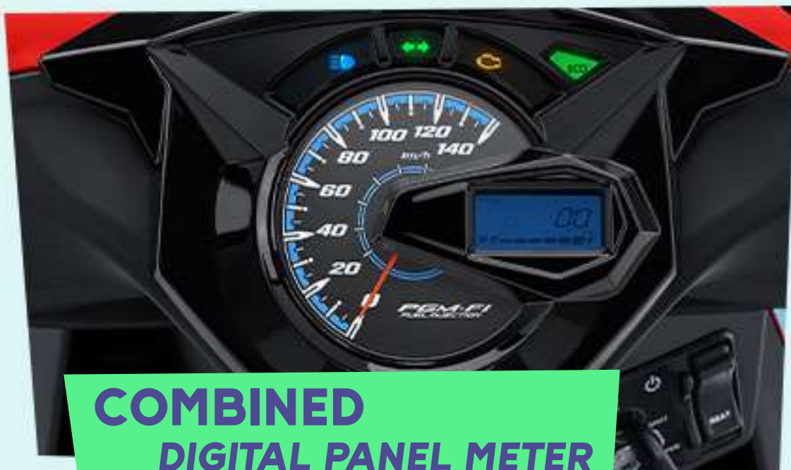
COMBINED DIGITAL PANEL METER