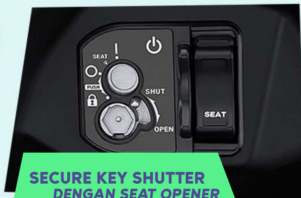
SECURE KEY SHUTTER DENGAN SEAT OPENER