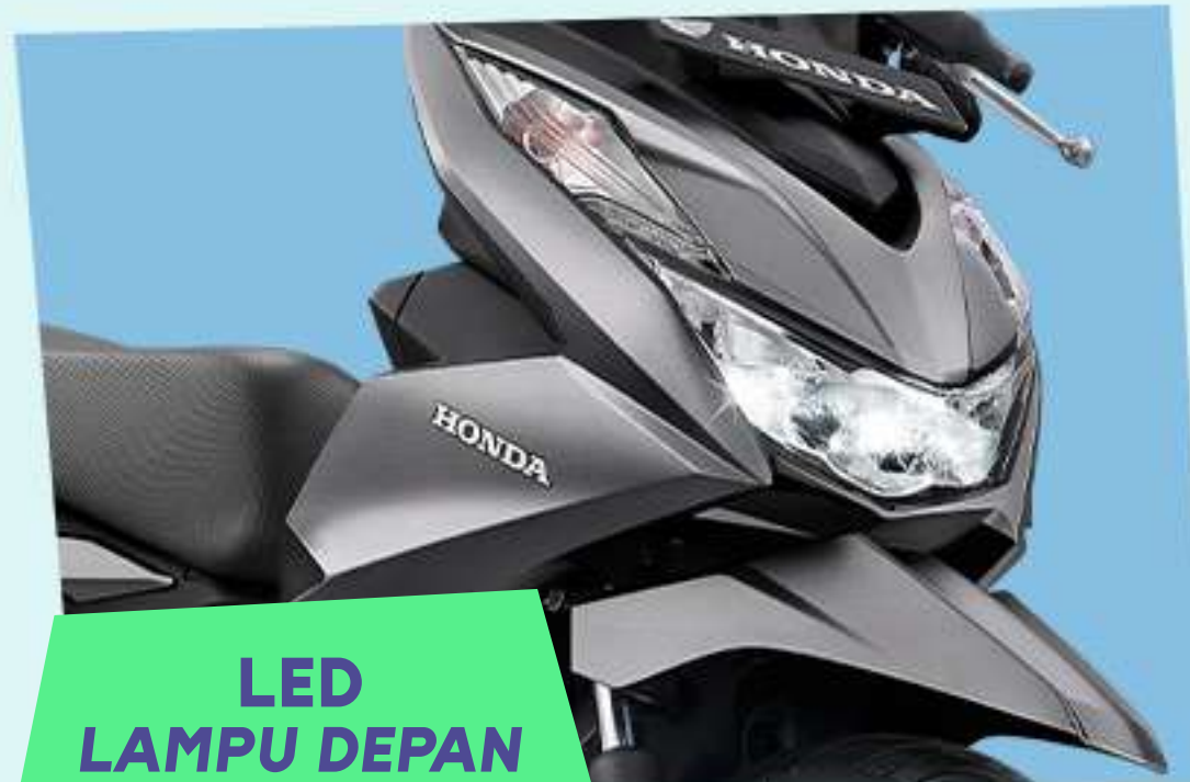
LED LAMPU DEPAN