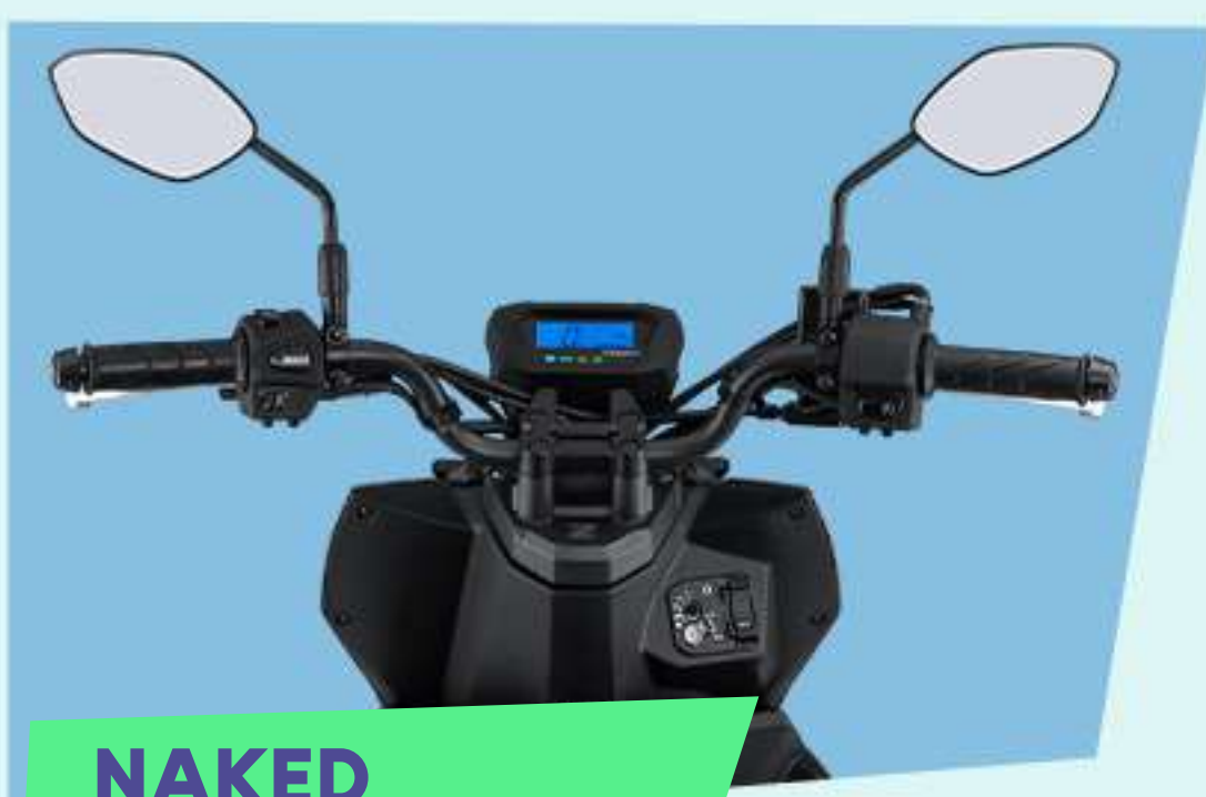
NAKED HANDLE BAR*