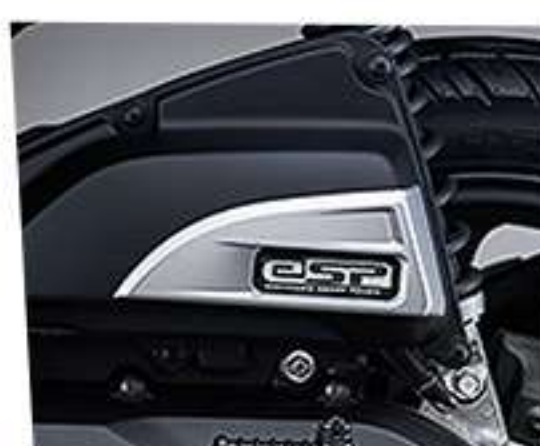
Garnish Air Cleaner*