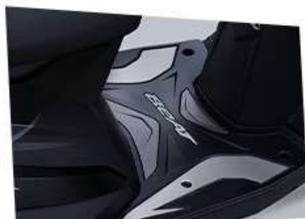
Rubber Step Floor*