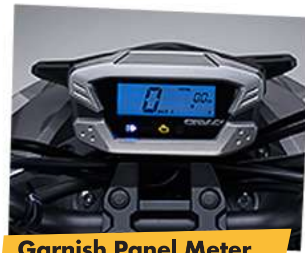
Garnish Panel Meter (khusus Honda BeAT Street)