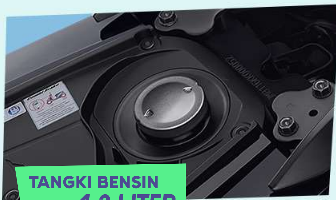
TANGKI BENSIN 4,2 LITER