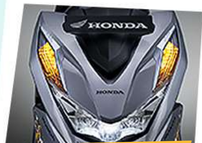
Garnish Front Winker*