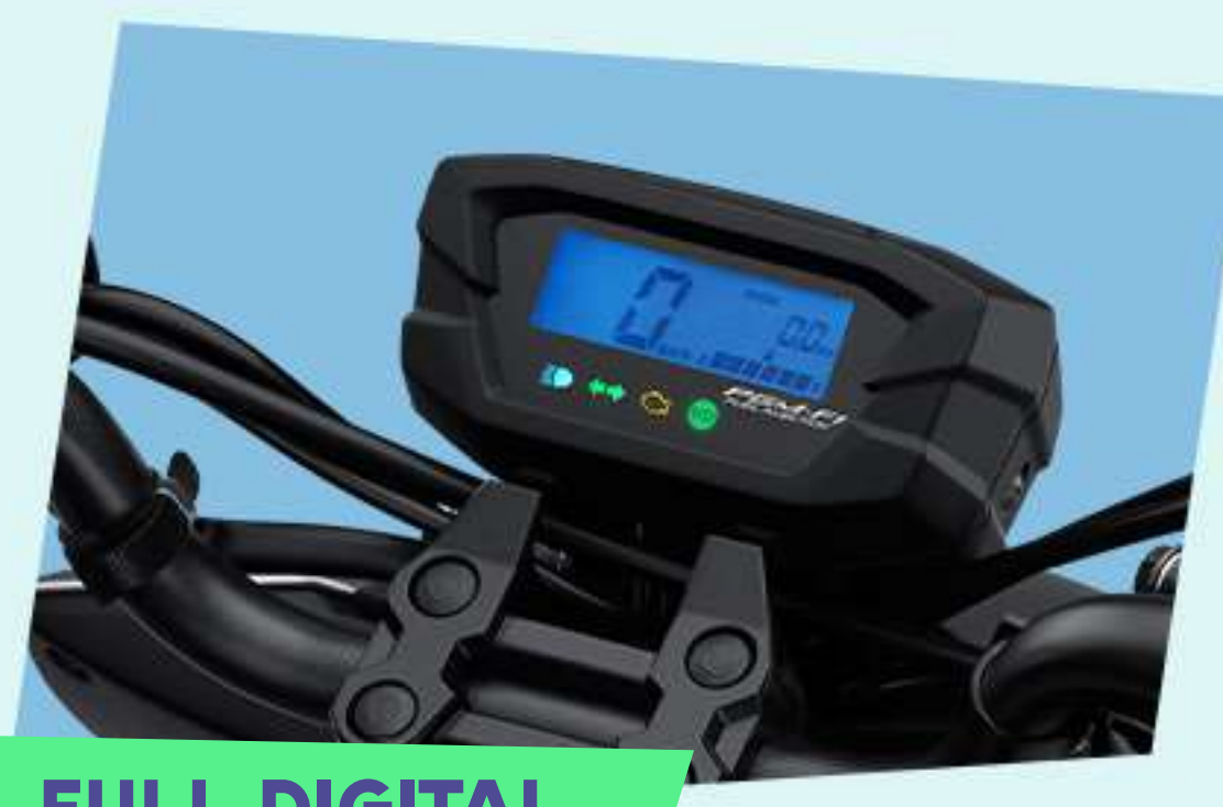
FULL DIGITAL PANEL METER*