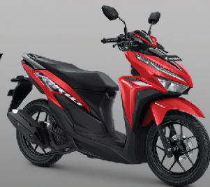
Baru Advance Red (CBS)