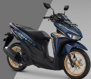
Warna Spesial Advance Matte Blue (CBS-ISS)

Spesifikasi dapat berubah sewaktu-waktu tanpa pemberitahuan terlebih dahulu untuk meningkatkan mutu motor Honda.