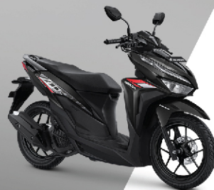
Baru Advance Black (CBS)