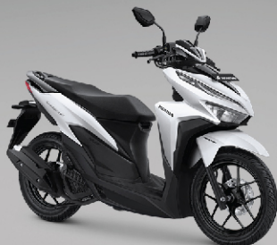
Baru Advance Matte White (CBS-ISS)