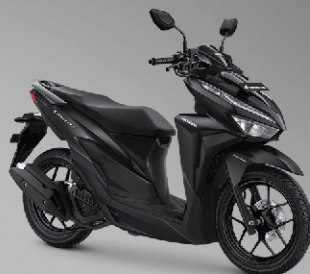
Advance Matte Black (CBS-ISS)