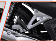
PIJAKAN KAKI BELAKANG ALUMINIUM SPORTY

Bagasi fungsional yang praktis untuk membawa barang kebutuhan ketika berkendara.