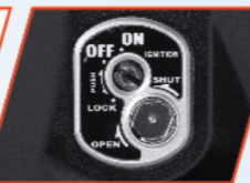
PENGAMAN KUNCI KONTAK BERMAGNET OTOMATIS*

Desain digital panelmeter terbaru dengan nuansa merah yang modern, sporty , serta tetap nyaman dilihat.