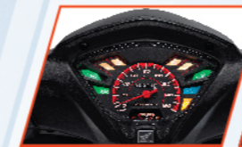
PANELMETER MODERN DAN SPORTY*

Desain digital panelmeter terbaru dengan nuansa merah yang modern, sporty , serta tetap nyaman dilihat.