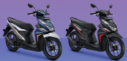
CBS-ISS SERIES: ELECTRO MATTE BLUE, GARAGE MATTE BLACK