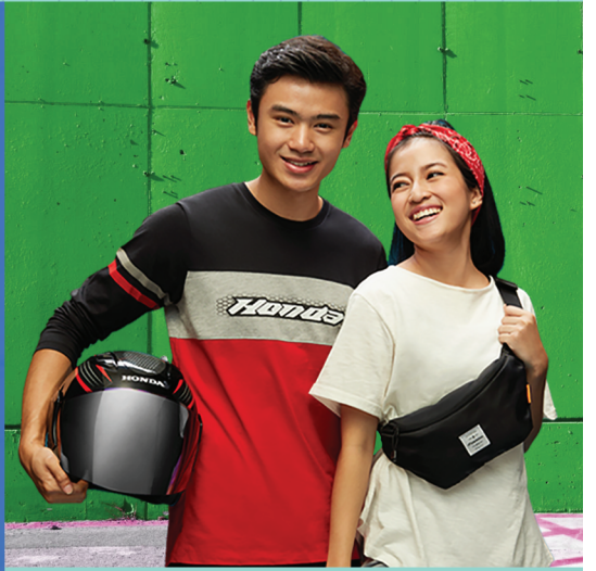
BeAT APPARELS: HELMET, T-SHIRT, LONG SHIRT, SLING BAG

Mudah dikendalikan dan lincah tiap berkendara dengan frame berteknologi baru buat yang selalu siap jalan ke berbagai tujuan.