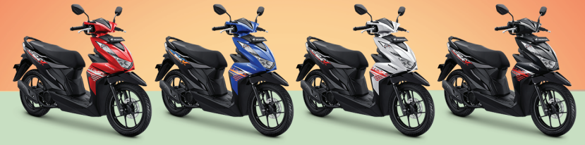
CBS SERIES: FUNK RED BLACK, TECHNO BLUE WHITE, DANCE WHITE BLACK, HARD ROCK BLACK