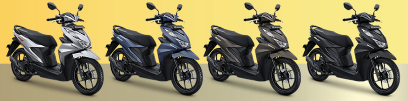
DELUXE SERIES (CBS-ISS): DELUXE SILVER, DELUXE BLUE, DELUXE BROWN, DELUXE BLACK