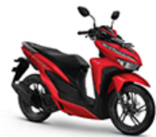
EXCLUSIVE MATTE RED