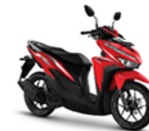
ADVANCE RED CBS-ISS TYPE

KELISTRIKAN Full Transisterized MF 12V-5 Ah NGK CPR9EA-9 / Denso U27EPR9