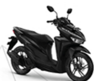
EXCLUSIVE MATTE BLACK