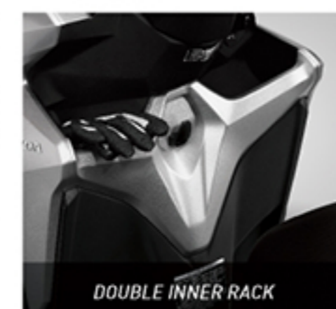
DOUBLE INNER RACK