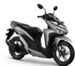
EXCLUSIVE MATTE SILVER