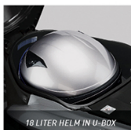
18 LITER HELM IN U-BOX