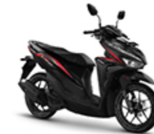
ADVANCE BLACK CBS-ISS TYPE & CBS TYPE