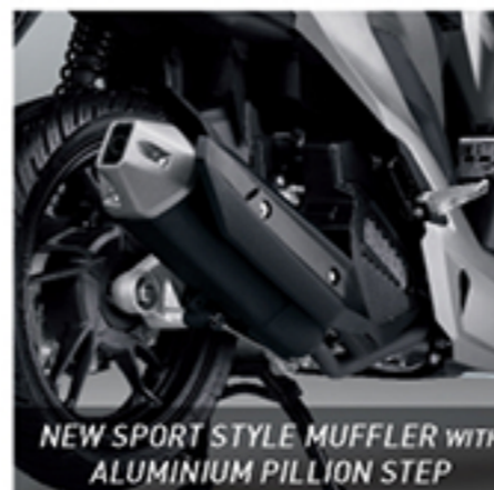
NEW SPORT STYLE MUFFLER WITH ALUMINIUM PILLION STEP