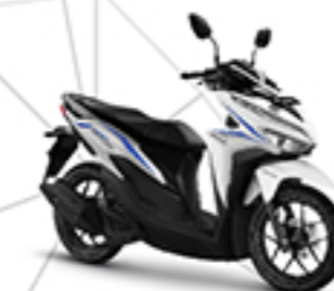
ADVANCE WHITE BLUE CBS TYPE