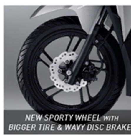
NEW SPORTY WHEEL WITH BIGGER TIRE & WAVY DISC BRAKE*