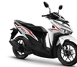
ADVANCE WHITE RED CBS-ISS TYPE