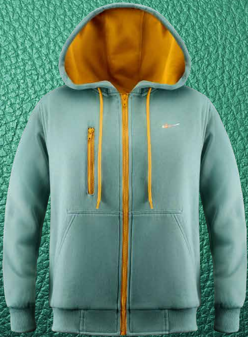
Soft Green Hoodie